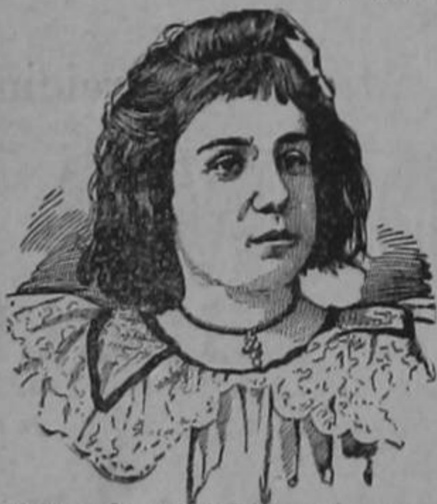
Tip. de "El Derecho"

SCOTT & BOWNE, Químicos, New York. De venta en las Boticas.